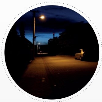
Pred inštaláciou nového osvetlenia